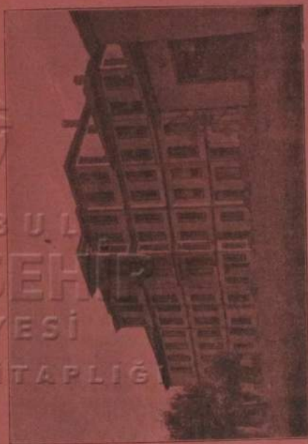
Le Grand Hôtel Splendide, en cours de construction

Situé à Tchekirgué et tenu par N. Derechian & C ie .