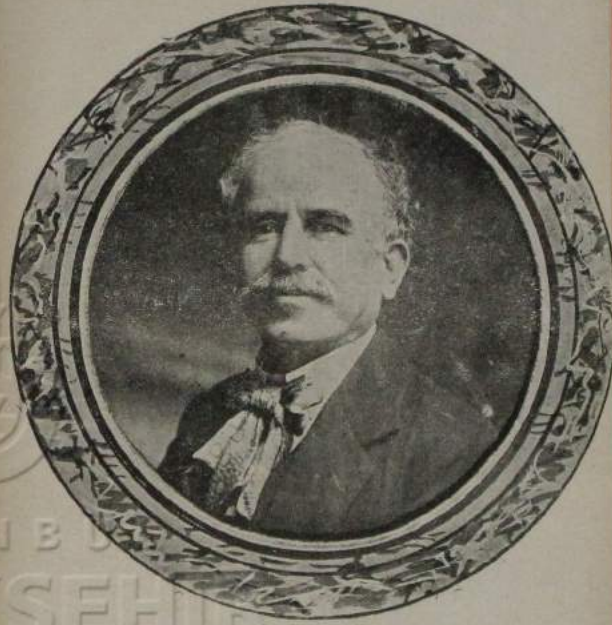
مضحک قسبی ناطمی: فهم افندی

سینه مار عصر مزک علویت و سفلیته مخصوص الک مکمل مکتبلر ماهیت و شکلی آلدی . سینه مارله ، ایستنه نیلیرسه بر اجتماعی هیئت اضلاله آرزو اولورسه اعلا اولنه بیایر . قیصه ، صریح ، عادنا ذی روح بر ماهیتله خاق بیك چوقشی اوکره نیر . بر عصر اق فضیلتی یازیم ساعتک بر زمانده جایله ، قایتله ، روحیله ،